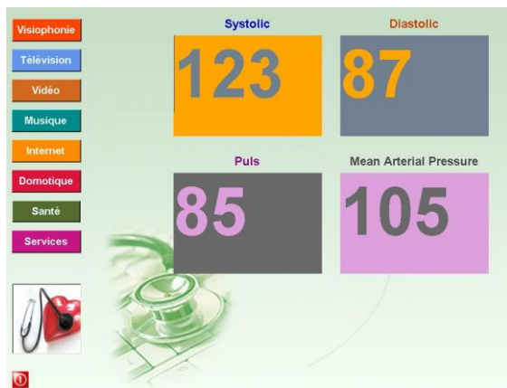
Figure 2: Interface utilisateur – Partie Santé

D'autre part, le projet s'est attaché et s'est concentré à développer une interface ergonomique et simple d'utilisation, garantissant un niveau maximum d'appropriation de la part des utilisateurs. L'interface, son accessibilité et son ergonomie ont été respectées au plus prêt des attentes et remarques des utilisateurs analysées en amont du développement de l'interface et ont démontrées le grand degré d'importance dans ce type de développement. La Figure 2 présente la partie santé (mesure de la tension artérielle du résident) de l'interface utilisateur de notre système.